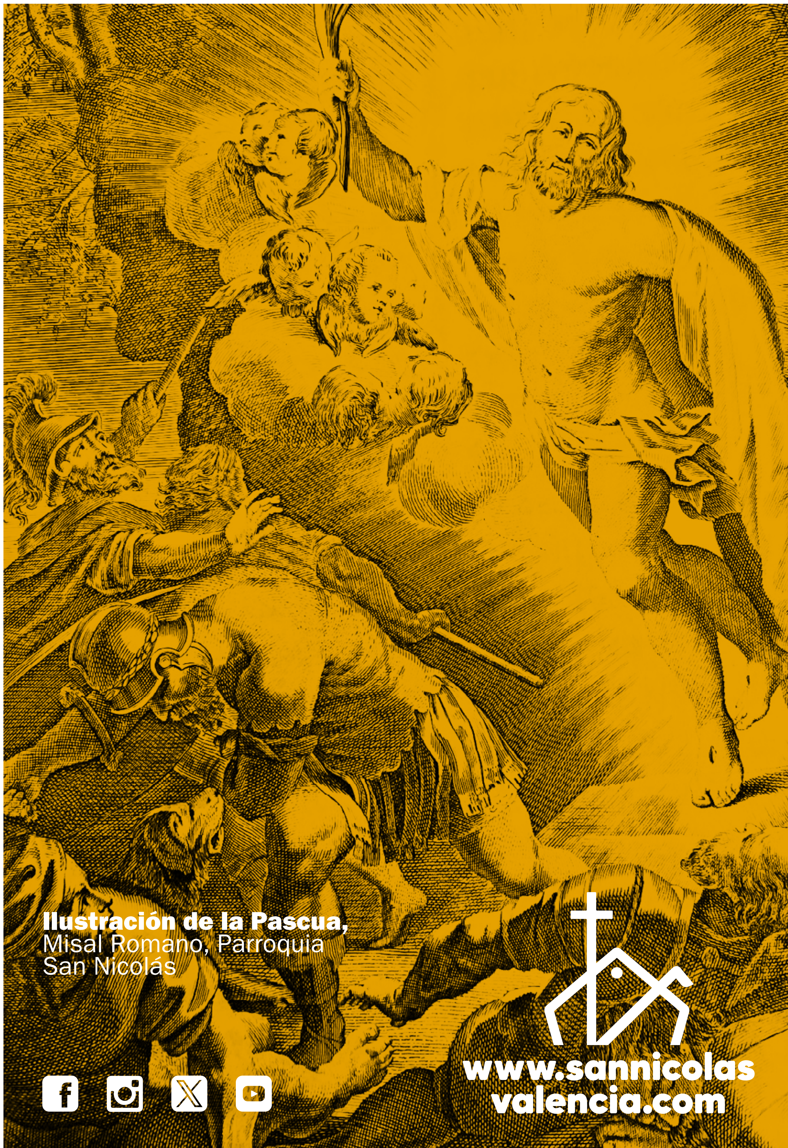
Ilustración de la Pascua, Misal Romano, Parroquia San Nicolás

Regina caeli laetare, alleluia: Quia quem meruisti portare, alleluia: Resurrexit sicut dixit, alleluia: Ora pro nobis Deum, alleluia.