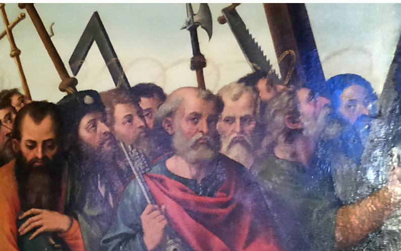
Fragmento del Retablo de La Trinidad, obra de Juan de Juanes